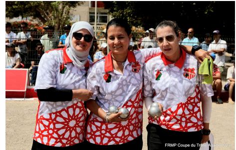
أوعابة لطيفة- خولان وصال- ادحيش حياة