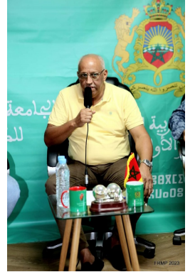
السيد خالد المنصوري رئيس الجامعة الملكية المغربية للكرة الحديدية

عقد رئيس الجامعة الملكية المغربية السيد خالد المنصوري ندوة صحفية، يوم السبت 14 أكتوبر 2023 بمقر الجامعة. حضرها بعض الأعضاء الجامعيين والمدير التقني للجامعة والنشطاء المعتمدين من طرف العصب الجهوية في مجال الأعلام الرياضي. تم خلال هذا اللقاء الصحفي، تسليط الضوء على مشاركة المغرب في المنافسات الدولية. وإعطاء بعض التوضيحات حول ملف ترشح المغرب لاحتضان تنظيم بطولة العالم.